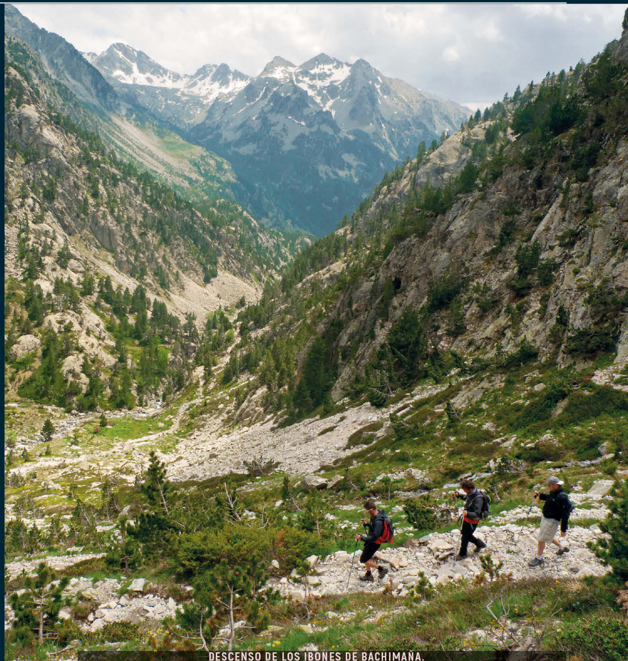
DESCENSO DE LOS IBONES DE BACHIMAÑA.

Desde Panticosa pueblo hemos de tomar la carretera A-2606 que asciende hasta el balneario.