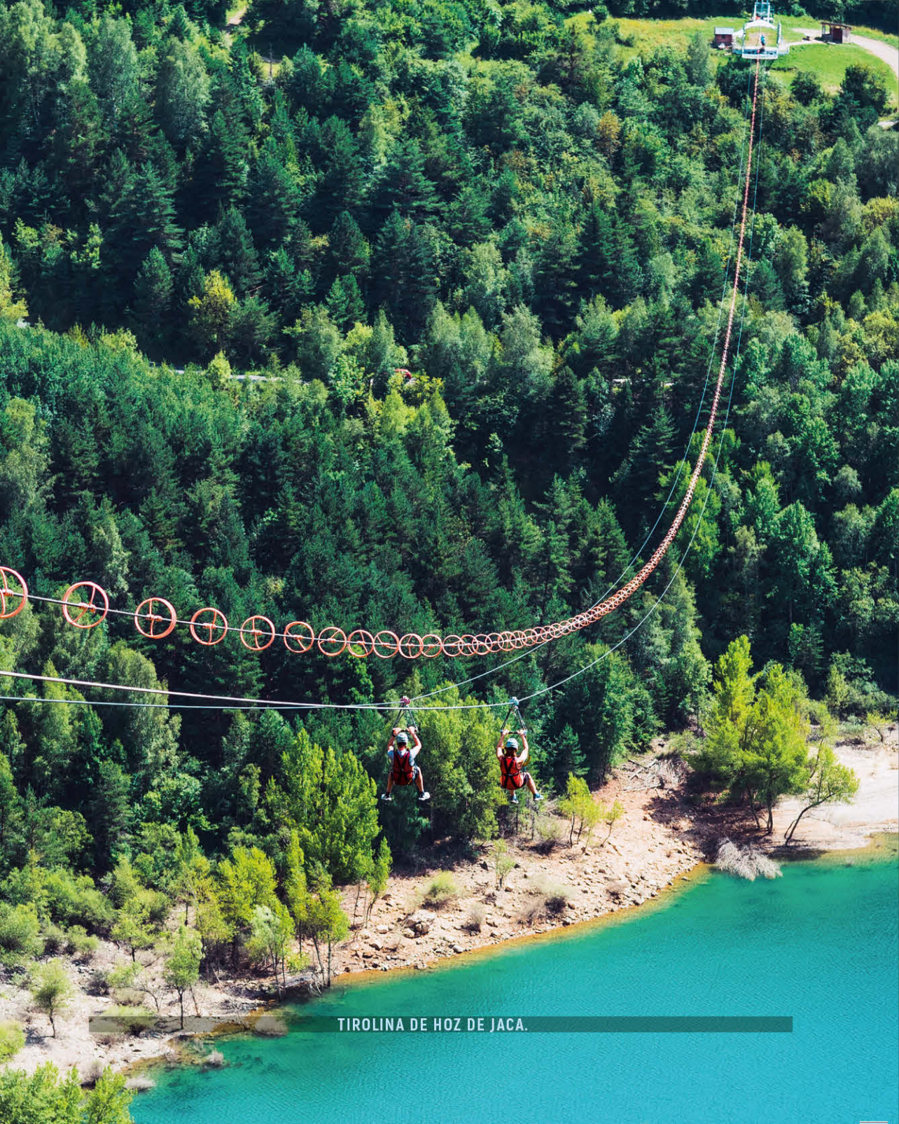
TIROLINA DE HOZ DE JACA.