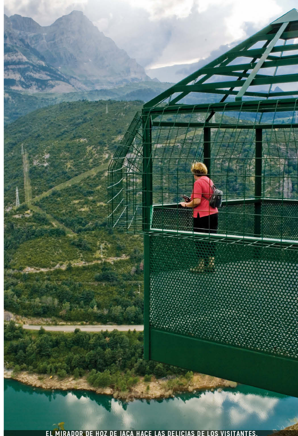
EL MIRADOR DE HOZ DE JACA HACE LAS DELICIAS DE LOS VISITANTES.

Dentro del núcleo, en la salida hacia El Pueyo se ha instalado una larguísima tiro-lina, de gran aceptación, que ha incrementado notablemente la afluencia de visitantes.