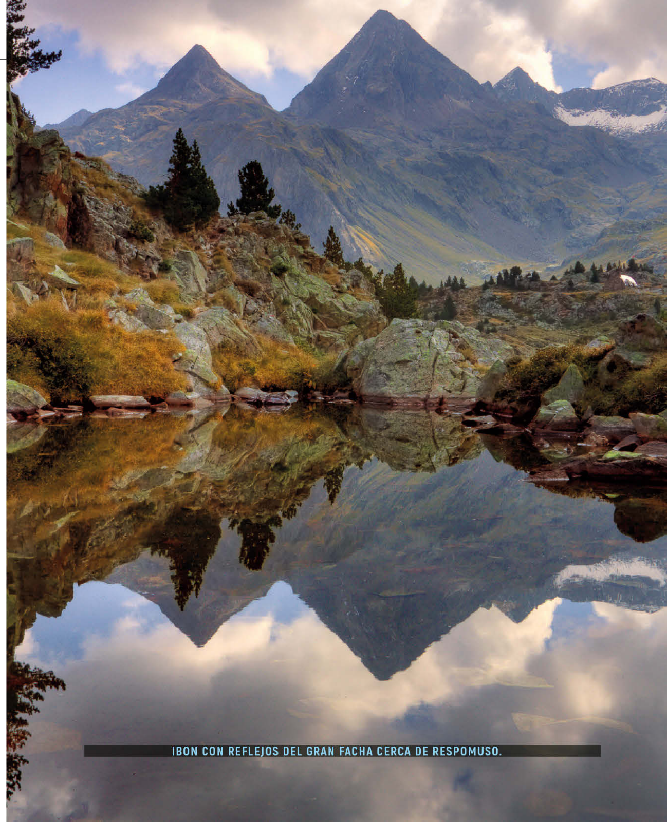
IBON CON REFLEJOS DEL GRAN FACHA CERCA DE RESPOMUSO.